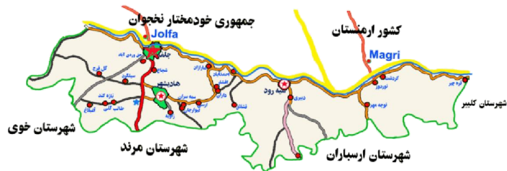
شکل 2 منطقه آزاد ارس (شهرها و کشورهای همجوار)

طرح پایه آمایش استان آذربایجان شرقی معتبرترین و به‌روزترین سند فرادست موجود به‌شمار می‌آید. این طرح مبنای تمام تصمیم‌گیری‌های آمایشی و بخشی استان قرار گرفته است و مأموریت‌ها و وظایف اصلی استان و برنامه‌های اجرایی در قالب برنامه توسعه پنج‌ساله و سالانه استان همسو با تحقق اهداف مصوب این سند صورت می‌گیرد (شورای آمایش سرزمین، 1384).