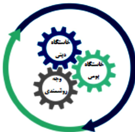
شکل ۱: خاستگاه‌های اثرگذار بر طراحی الگوی اسلامی - ایرانی مدیریت توسعهی روستایی

نخست مبانی ناظر به خاستگاه معرفتی و دینی است که ناظر بر وجه اسلامیت طراحی الگوست. دوم مبانی ناظر به خاستگاه بومی و محیط اجرای الگوست که توجه به ایرانیت الگوست، و سوم مبانی ناظر بر منطق طراحی الگو یا وجه روشمندی الگو و سازوکار علمی آن است که ناظر بر علمیت طراحی الگوست (الویری، ۱۳۹۱: ۸۱؛ وکیلی، ۱۳۹۲: ۵).