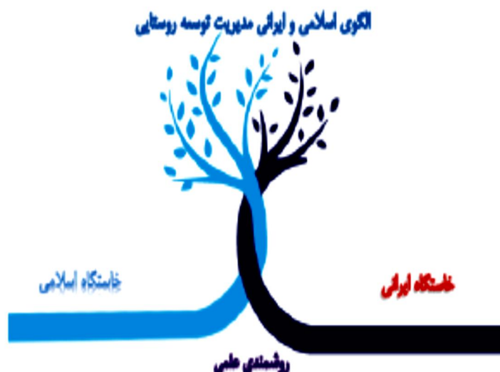
شکل ۶: تعامل ایرانی‌ت و اسلامیت در شکل‌دهی مدیریت توسعه‌ی روستایی

مطابق با معنی ارائه‌شده، اقتضای قید اسلامی بودن در تعریف مدیریت اسلامی بر این مبنا استوار است که باید مفاهیم، شاخص‌ها و اساساً هر چیزی که در معرفی مدیریت دخیل است، ناظر به تعریفی اسلامی از مدیریت باشد و بر مبانی نظری، فلسفی و انسان‌شناختی اسلام مبتنی شده باشد. همچنین ایرانی بودن الگو ناظر به این است که باید در زمینه‌ی پیشرفت، شرایط بومی را در نظر گرفت. به دلیل تفاوت در شرایط تاریخی، طبیعی، جغرافیایی، مکانی و زمانی، جغرافیای سیاسی و شرایط انسانی و فرهنگی، کشور نیازمند الگوی خاص خود است. در عین حال، قید ایرانی بودن ناظر به این مهم نیز هست که طراحی الگو توسط متفکران ایرانی و با توجه به مصالح و منافع کشور باید انجام شود (افجه‌ای و جعفرپور، ۱۳۹۱: ۱۹؛ علایی، ۱۳۹۵: ۷۲). بر این مبنا هدف مدیریت روستایی ایجاد رابطه‌ای منطقی و تنظیم‌شده بین انسان و محیط برای رسیدن به رضایتمندی و خشنودی در زندگی مردم مناطق روستایی است که در رأس آن وجود عنصری نهادی برای برنامه‌ریزی آینده و اداره‌ی کنونی روستا ضروری است و این عنصر باید از طریق همکاری متعادل و فعال نیروهای بیرونی و درونی صورت گیرد. بر این مبنا سه اصل گفتمان، دستیابی به اجماع و رضایتمندی، هسته‌ی کانونی مدیریت روستایی را تشکیل می‌دهند (بدری و همکاران، ۱۳۸۷: ۶۲).