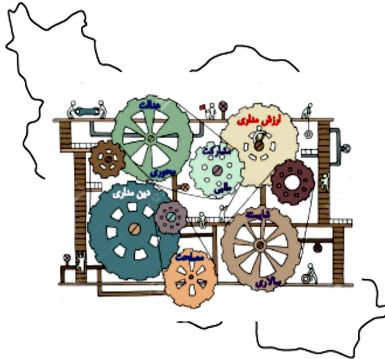
شکل ۵: شاکله‌های محوری نظام مدیریت توسعه‌ی روستایی بر اساس الگوی اسلامی و ایرانی

اقسام عدالت در اسلام بر دو بخش است. یکی عدالت تکوینی که ناظر بر عدلی است که از حق و منبع آن که خالق هستی است ناشی می‌شود، و دیگری عدالت تشریحی است که بر عادلانه بودن احکام الهی که توسط پیامبران به انسان‌ها ابلاغ شده یا به طور غیرمستقیم درصدد فراهم نمودن زمینه‌ی تحقق عدالت‌اند و امری اقامه‌شدنی محسوب می‌شوند، دلالت دارند. عدالت تشریحی نیز خود به دو قسم عدالت فردی و اجتماعی تقسیم می‌شود که در این راستا عدالت اجتماعی ناظر بر مجموعه ارزش‌های اخلاقی و احکام اسلامی است که موجبات تحقق عدالت در شئون گوناگون جامعه از جمله اقتصاد، سیاست، فرهنگ و قضاوت را فراهم می‌کند.