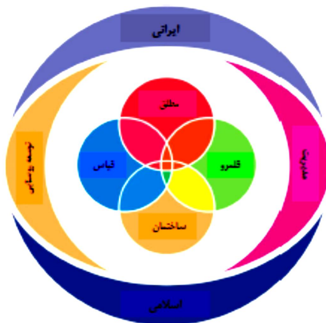
شکل ۴: شاکله‌های الگوی اسلامی و ایرانی مدیریت توسعه‌ی روستایی

بدین ترتیب همان‌طور که شکل (۴) نشان می‌دهد، شاکله‌های الگوی اسلامی و ایرانی مدیریت توسعه‌ی روستایی علاوه بر بینش و جهان‌بینی الهی، دارای وجوه عینی و واقعی بر اساس مستندات، ساختمانی خاص با شاخص‌های معین، قلمرویی وسیع در ورای معیارهای مادی و قیاسی از رویدادهای واقعی در سطح مناطق روستایی کشور است.