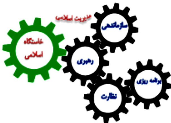
شکل ۲: خاستگاه معرفتی و دینی اسلام در فرایند مدیریت توسعه‌ی روستایی