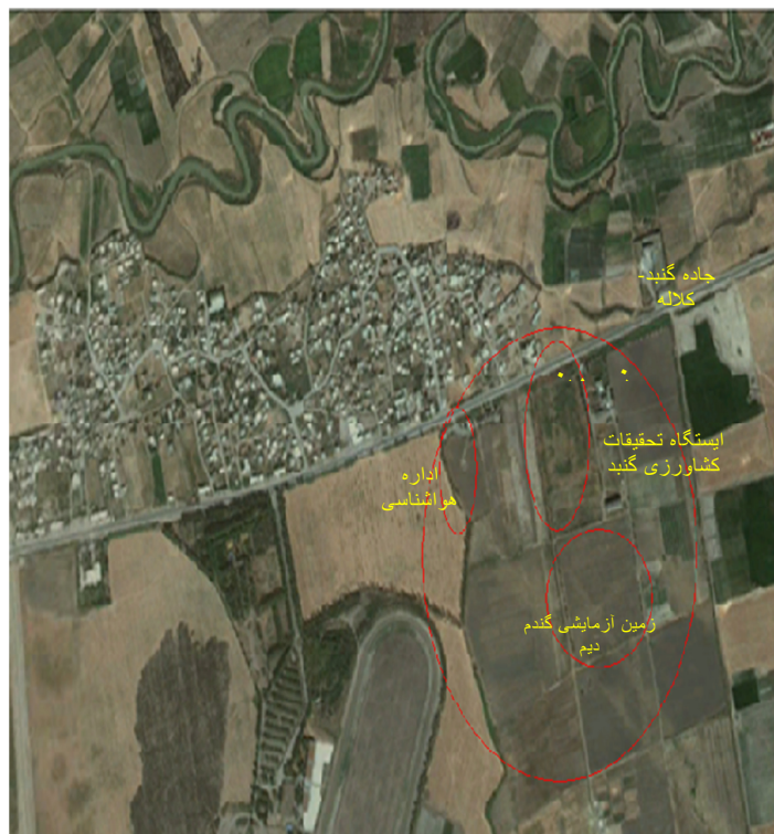
شکل ۲ عکس ماهواره‌ای مزرعه آزمایشی