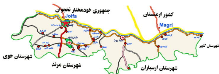
شکل 2 منطقه آزاد ارس (شهرها و کشورهای همجوار)

طرح پایه آمایش استان آذربایجان شرقی معتبرترین و به‌روزترین سند فرادست موجود به‌شمار می‌آید. این طرح مبنای تمام تصمیم‌گیری‌های آمایشی و بخشی استان قرار گرفته است و مأموریت‌ها و وظایف اصلی استان و برنامه‌های اجرایی در قالب برنامه توسعه پنج‌ساله و سالانه استان همسو با تحقق اهداف مصوب این سند صورت می‌گیرد (شورای آمایش سرزمین، 1384).