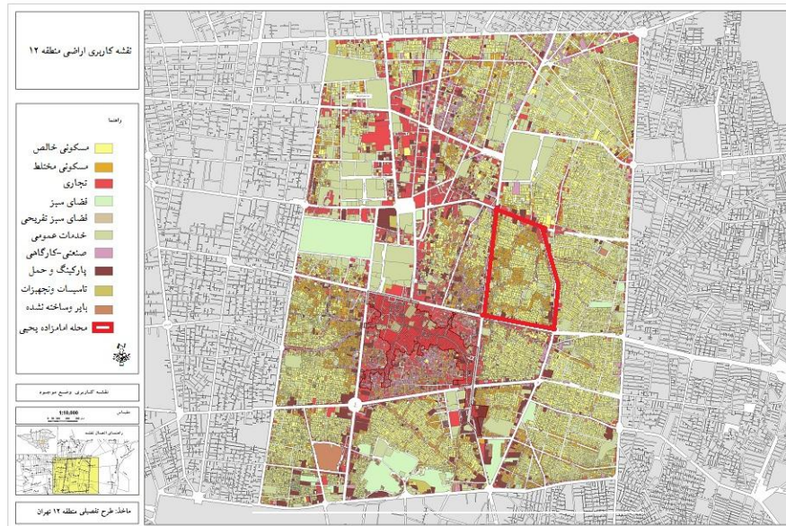
شکل 2 کاربری اراضی محدوده مطالعه