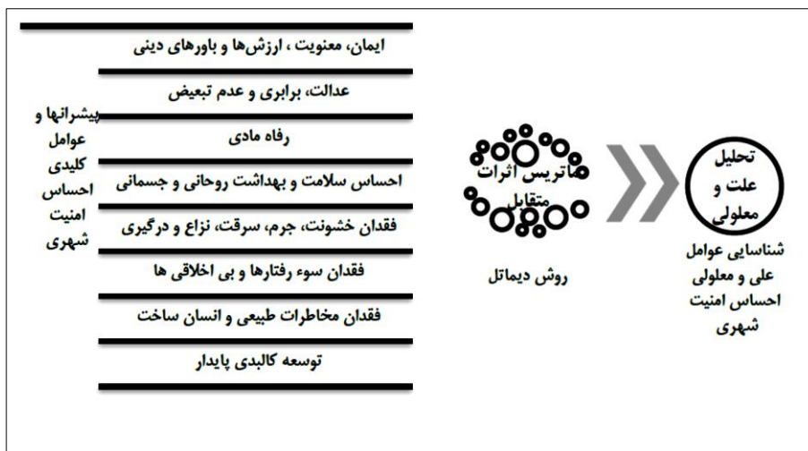
شکل ۱: مدل مفهومی تحقیق