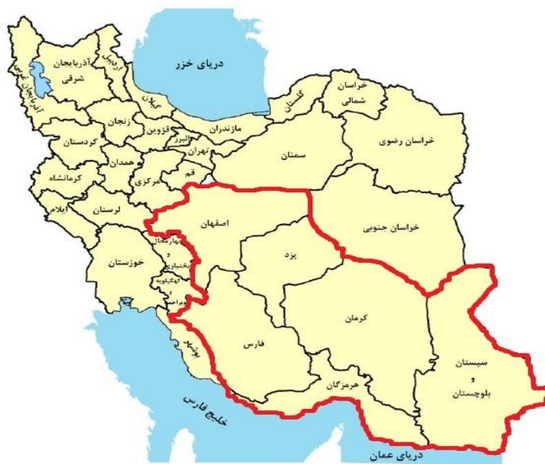
شکل ۲. محدوده مکانی تحقیق

در این پژوهش، از مدل اقتصاد سنجی فضایی برای بررسی عوامل اقتصادی مؤثر بر سطح زیر کشت محصولات زراعی در شش استان ایران که دارای اقلیمی خشک در بازه زمانی ۱۳۹۲-۱۳۹۷ بوده، استفاده شده است. اطلاعات مورد نیاز از درگاه ملی آمار، سالنامه‌های آماری، آمارنامه‌های کشاورزی و مرکز هواشناسی کشور دریافت شد. محدوده مکانی این پژوهش در شکل (۱) با خطوط پررنگ مشخص شده است.