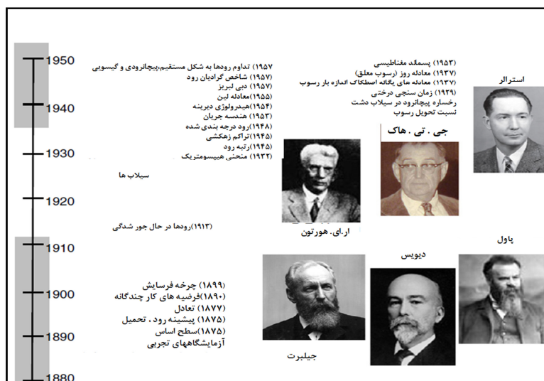
شکل ۱ خط زمانی مدل‌های مفهومی، محیط‌های رودخانه‌ای و ابزارهای مورد استفاده پیش از ۱۹۶۰

فعالیت‌ها در دو دوره متمرکز بودن: از دهه ۱۸۷۰ تا دهه اول قرن بیستم و از دهه ۱۹۳۰ تا دهه ۱۹۵۰.