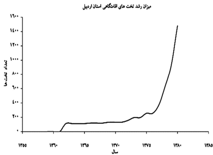
شکل ۳ نمودار افزایش تخت‌های اقامتگاهی استان اردبیل و کشور طی سال‌های بعد از انقلاب (مدرسی، ۱۳۷۸؛ معاونت تحقیقات آموزش و برنامه‌ریزی)