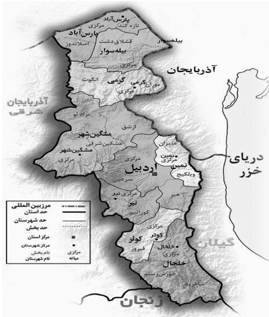
شکل ۱ محدوده سیاسی استان اردبیل