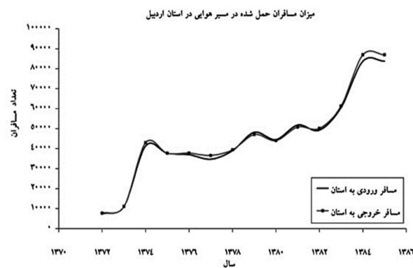
شکل ۵ رشد مسافران جابه‌جا شده در مسیر فرودگاه اردبیل در برابر آمار کل کشور طی سال‌های ۱۳۷۲-۱۳۸۵