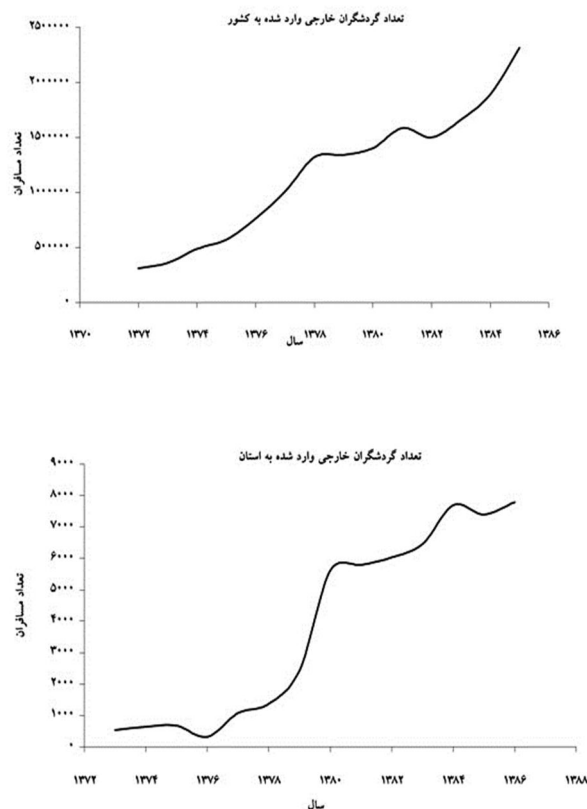
شکل ۶ رشد تعداد گردشگران خارجی وارد شده به اردبیل و کشور در سال‌های ۱۳۷۲-۱۳۸۵

بر اساس آمار تعداد جهانگردان خارجی طی برنامه پنج‌ساله دوم توسعه، رشد جهانگردان به جز سال ۱۳۷۶ که به دلیل کاهش مسافران کشور آذربایجان بوده، روندی صعودی داشته است. در طول برنامه دوم توسعه، رشد گردشگران داخلی ۵۴/۱ درصد و رشد گردشگران خارجی ۱۱۳ درصد افزایش را نشان می‌دهد. اما رشد گردشگران خارجی در برنامه سوم توسعه بیش از گردشگران داخلی بوده است؛ به گونه‌ای که میزان رشد گردشگران خارجی ۱۶۶ درصد و رشد گردشگران داخلی ۱۸/۳ بوده است (شکل ۶).