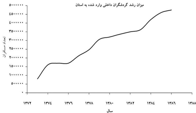
شکل ۷ رشد گردشگران داخلی وارد شده به استان اردبیل طی سالهای ۱۳۷۳-۱۳۸۶

اما در برنامه چهارم توسعه، گردشگران داخلی با توجه به زمینه و استعداد موجود در این بخش در طی برنامه کوتاه مدت پنج ساله، رشد به مراتب بیشتری نسبت به رشد گردشگران خارجی داشته است. بر اساس آمار منتشر شده در این مورد، تا پایان سال ۱۳۸۸ تعداد گردشگران خارجی با رشد ۱۰/۳ درصد به ۸۵۰۰ نفر و گردشگران داخلی با رشد ۳۹/۵ درصد به ۵/۹۰۰/۰۰۰ نفر می رسد (برآوردهای راهبردی گردشگری استان اردبیل در برنامه پنج ساله چهارم توسعه- تکبرگی) که به وضوح بیانگر بهره مند نبودن استان از گردشگران خارجی است (شکل ۷).