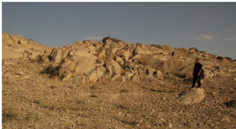
شکل ۳ معدن سنگ خام سنگ‌افراشته‌های انسان ریخت محوطه شهری

همچنین دسترسی و وجود معدن سنگ خام برای ساخت سنگ‌افراشته‌های انسان ریخت که جز لاینفک مراسم آیینی این اقوام بوده برای ساکنان واجد اهمیت بوده است. با توجه به شناسایی معدن سنگ خام مناسب در فاصله سه کیلومتری از محوطه این مهم را میسر ساخته که این امر می‌تواند یکی از پتانسیل‌های مکان‌گزینی محوطه مورد نظر قرار گیرد (شکل ۳).