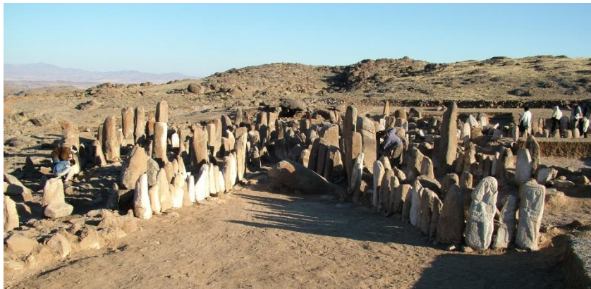
شکل ۷ نمایی کلی از محوطه معبد