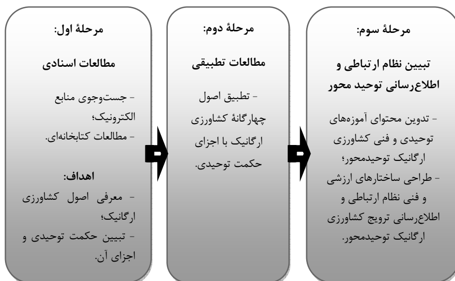
شکل ۱ مراحل اجرای پژوهش