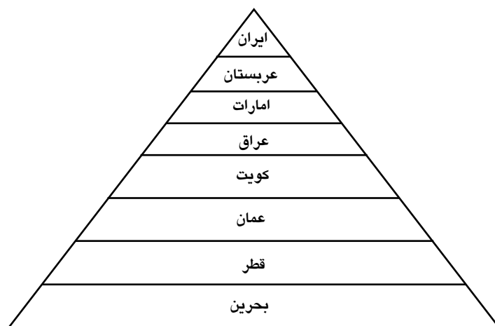
شکل ۱ هرم سطوح قدرت در حوزه خلیج فارس براساس مدل فوکس

بوده و نشان می‌دهد که قدرت درجه اول حوزه خلیج فارس کشور ایران و قدرت درجه اول حوزه مدیترانه، کشور ترکیه است. سطوح قدرت در این دو منطقه حساس در شکل‌های ۱ و ۲ نشان داده شده است.