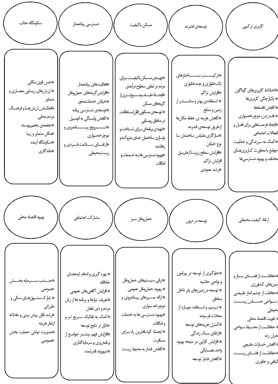
شکل ۱: اصول و مفاهیم پایه‌ای الگوی رشد هوشمند

(ICMA, 2002: 5; SGN, 2002: 5; رهنما و عباس‌زاده، ۱۳۸۷: ۴۹؛ حسین‌زاده دلیر و صفری، ۱۳۹۱: