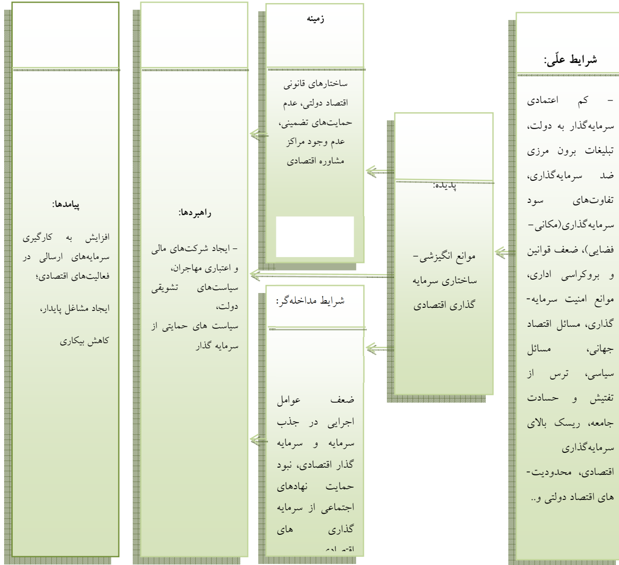
شکل ۲. مدل کانونی پژوهش