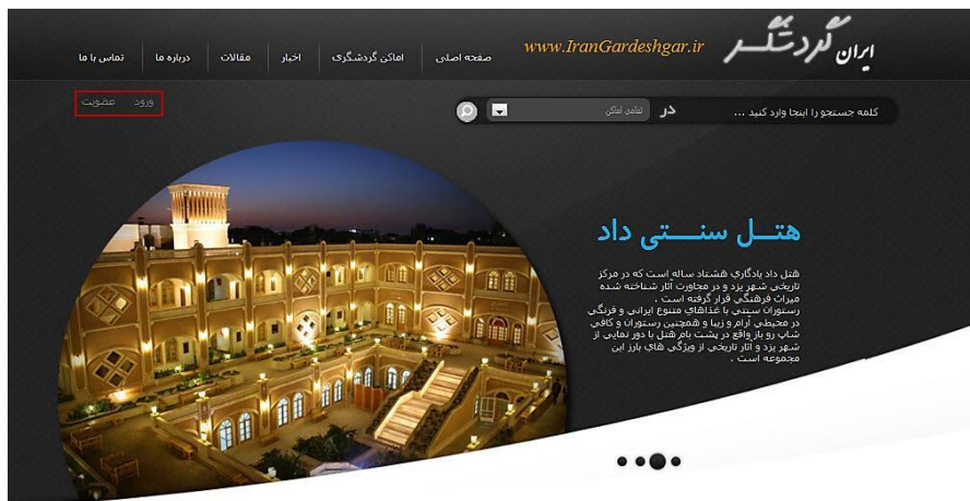
شکل ۲ صفحه اول سایت ایران گردشگر با امکان ثبت نام و عضویت کاربر

پس از اینکه کاربر وارد پروفایل کاربری می شود و عضویت خود را به منظور ارائه پیشنهاد ثبت می کند، به سمت مرحله استدلال نمونه محور هدایت می شود. در این مرحله، پانزده آیتم با توزیعی یکنواخت در پنج بخش مکان های تاریخی، تجاری، طبیعی، فرهنگی و مذهبی براساس تعداد کل آیتم های هر بخش نسبت به کل آیتم ها در پایگاه داده، به کاربر هدف عرضه می شود. با استفاده از نمونه های یادشده کاربر هدف رفتارسنجی می شود. این رفتارسنجی به این صورت است که کاربر با توجه به میزان علاقه خود به مکان مورد نظر، رتبه ای بین ۱ تا ۱۰ به آن ها می دهد. از طریق این رتبه ها، علایق و رفتارهای کاربر در مورد مکان های گردشگری شبیه به مکان های یادشده به راحتی قابل استخراج است.