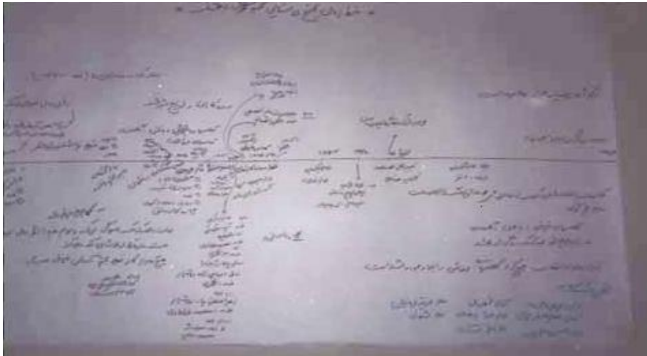
شکل 6 خط زمان مجتمع بهزیستی روستای دهشک

بعد از انقلاب در مجتمع بهزیستی روستای امام تقی علاوه بر کلاس مهد و آمادگی، کلاسهای آموزش لحاف‌دوزی نیز در سال 1360 هـ. ش. برگزار شد. این فعالیت در سال 1364 به دلیل به وجود آمدن مشکل در تهیه مواد اولیه، تعطیل شد. فعالیتهای حرفه‌آموزی و آموزش قرآن و احکام و کتابخوانی مجتمع از تابستان 1373 آغاز شد. در مجتمع بهزیستی روستای دهشک فعالیتهای مختلف حرفه‌آموزی از سال 61 در مجتمع آغاز شد و در سال 71 تا 78 در مجتمع فعالیت مددکاری و توزیع شیرخشک نیز صورت می‌گرفته است. براساس خط زمان مجتمع بهزیستی روستای دهشک، در این مجتمع برخلاف دو مجتمع بهزیستی کورده و امام تقی تغییرات نیروی انسانی شاغل در مجتمع و مدیریتهای آن بسیار زیاد بوده است. در مجموع، ساختمان مجتمع بهزیستی روستای کورده نسبت به مجتمع روستاهای امام تقی و دهشک قدیمی‌تر است ولیکن به علت تعمیرات به موقع، این مجتمع مشکل خاصی ندارد و فعالیتهای آن چه در قبل از انقلاب و چه بعد از انقلاب نسبت به دو مجتمع دیگر از تنوع بیشتری برخوردار بوده است (شکلهای 6 و 7).