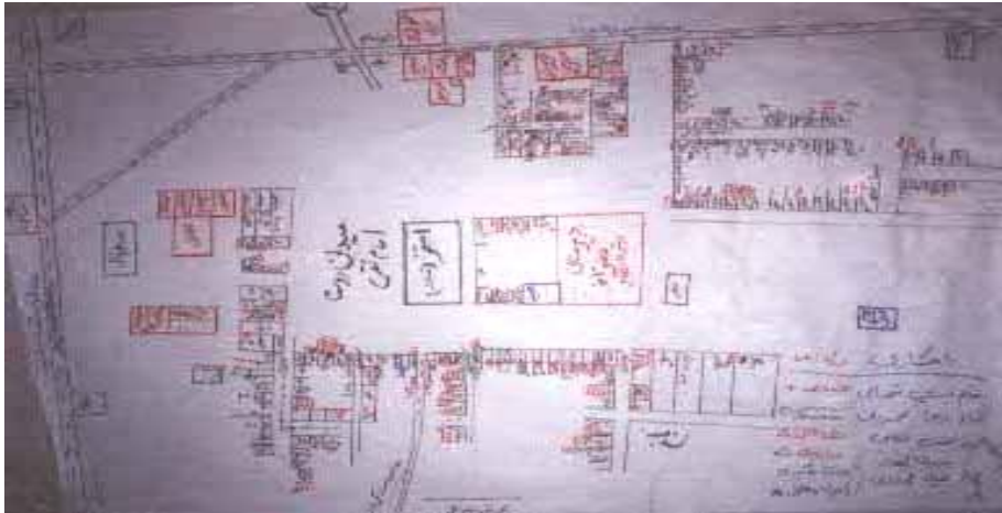
شکل 3 نقشه اجتماعی روستای امام تقی