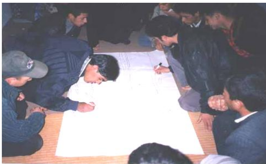
شکل 2 پسران روستای کورده در حال کشیدن نقشه اجتماعی روستا

از نظر مکان‌گزینی مجتمع، مجتمع بهزیستی روستای امام تقی به علت استقرار در کنار میدان اصلی روستا نسبت به دو مجتمع دیگر از مکان‌گزینی بهینه‌تری برخوردار است. پس از آن مجتمع بهزیستی روستای کورده قرار دارد؛ زیرا این مجتمع در نیمه جنوبی و نزدیک به مرکز روستا استقرار یافته است؛ اما مجتمع بهزیستی روستای دهشک در ابتدای جاده ورودی روستا واقع شده است و از مکان‌گزینی مناسبی برخوردار نمی‌باشد. بر اساس نقشه اجتماعی سه روستا که خدمات‌گیرندگان مجتمعها به تفکیک نوع خدمت دریافتی روی آن مشخص شده است، تنوع خدمات ارائه شده به وسیله مجتمع بهزیستی روستای کورده نسبت به دو روستای دیگر بیشتر است. اما از نظر پراکندگی فضایی فعالیت‌های مختلف، مجتمع بهزیستی روستاهای کورده و امام تقی توانسته‌اند تقریباً همه روستاییان ساکن در بخشهای مختلف روستا را تحت پوشش خود قرار دهند. اما در نقشه اجتماعی روستای دهشک گسستگی فضایی بین خدمات‌گیرندگان بخوبی احساس می‌شود. در عین حال، در هر سه مجتمع بیشترین تعداد خدمات‌گیرندگان را کودکان مهد به خود اختصاص داده‌اند (شکلهای 2 و 3).