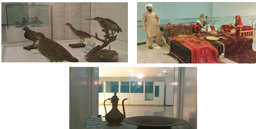
Figure 2- A view of the largest museum in the southeast of Iran

بخش‌های جانبی موزه شامل؛ رمپ، آکواریوم، کتابخانه، واحد اسناد و مدارک، سالن نمایش، تالار محققین جهت فعالیت‌های پژوهشی و تحقیقاتی، تالار رایانه، کارگاه‌های آموزشی، فنی، اتاق ساخت مولاژ، اتاق مرمت اشیاء، مخزن، عکاس‌خانه، سالن اجتماعات، کلاس‌های آموزشی، فضاهای اداری و سن رو باز با ظرفیت ۱۵۰ نفر است (سازمان میراث فرهنگی استان سیستان و بلوچستان، ۱۴۰۲).