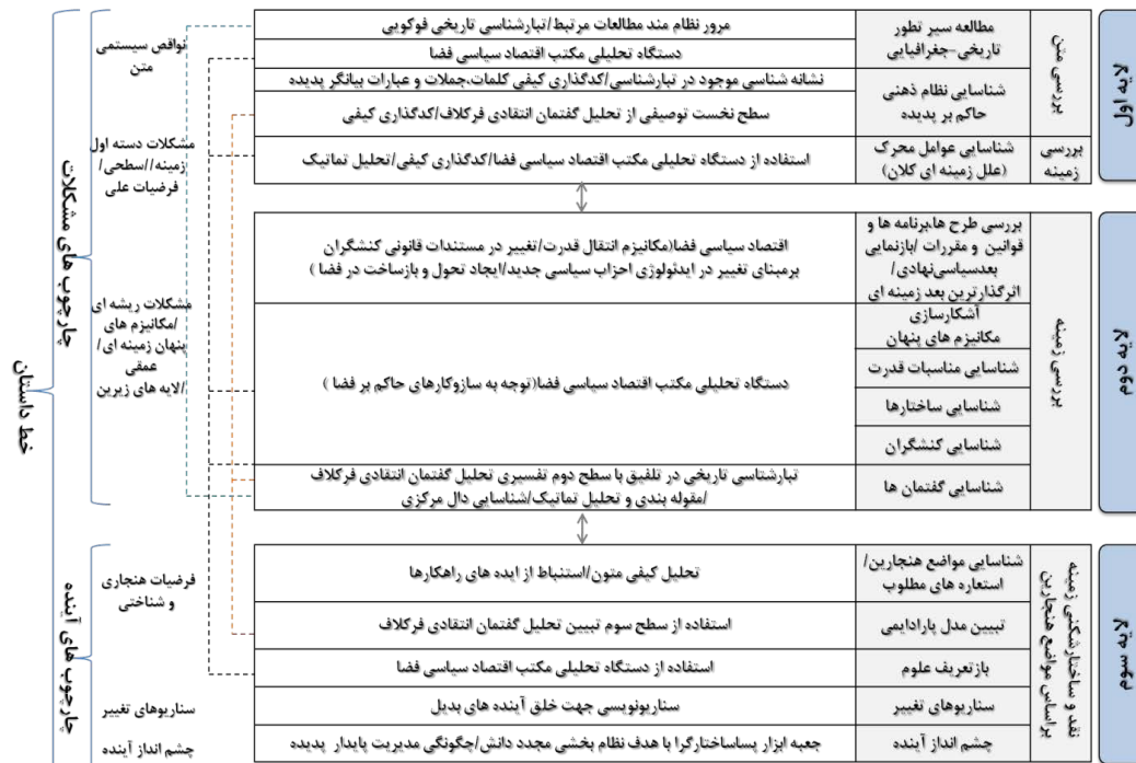
Chart 3- Methodological framework of the layers of the adjusted model