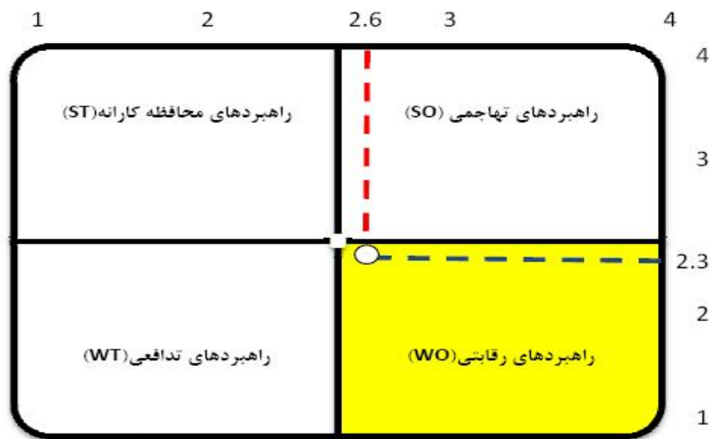
شکل ۵ انتخاب راهبردی توسعه گردشگری مذهبی در منطقه مورد مطالعه

تحلیل SWOT نشان می‌دهد از نظر مردم، عوامل داخلی (قوت‌ها و ضعف‌ها) دارای اهمیتی برابر با ۲/۶ و عوامل خارجی (فرصت‌ها و تهدیدها) دارای اهمیتی معادل ۲/۳ بوده‌اند. به این ترتیب، با عنایت به محور مختصات تهیه‌شده (ر.ک شکل ۵) می‌توان راهبرد رقابتی را برای توسعه گردشگری مذهبی در روستاهای مورد مطالعه براساس رهیافت مردمی پذیرفت.