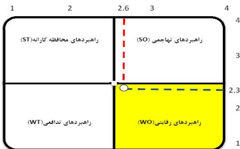
شکل ۵ انتخاب راهبردی توسعه گردشگری مذهبی در منطقه مورد مطالعه

تحلیل SWOT نشان می‌دهد از نظر مردم، عوامل داخلی (قوت‌ها و ضعف‌ها) دارای اهمیتی برابر با ۲/۶ و عوامل خارجی (فرصت‌ها و تهدیدها) دارای اهمیتی معادل ۲/۳ بوده‌اند. به این ترتیب، با عنایت به محور مختصات تهیه‌شده (ر.ک شکل ۵) می‌توان راهبرد رقابتی را برای توسعه گردشگری مذهبی در روستاهای مورد مطالعه براساس رهیافت مردمی پذیرفت.