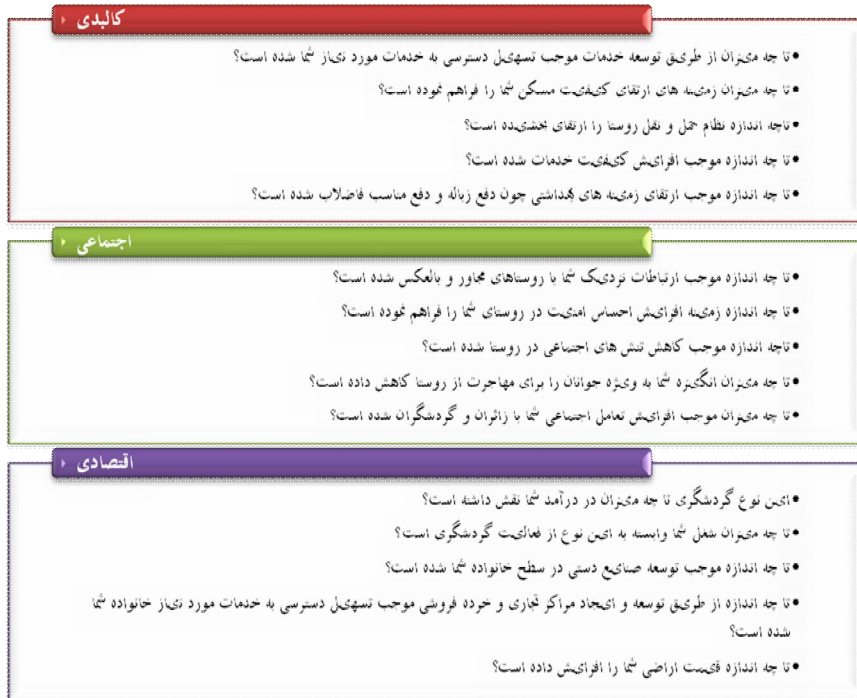
شکل ۱ گویه‌های تبیین‌کننده آثار گردشگری مذهبی بر خانوارهای روستایی

از دیدگاه شما حضور زائران و گردشگران مذهبی تا چه اندازه در هریک از گویه‌های اقتصادی، اجتماعی و کالبدی زیر مؤثر بوده‌اند؟