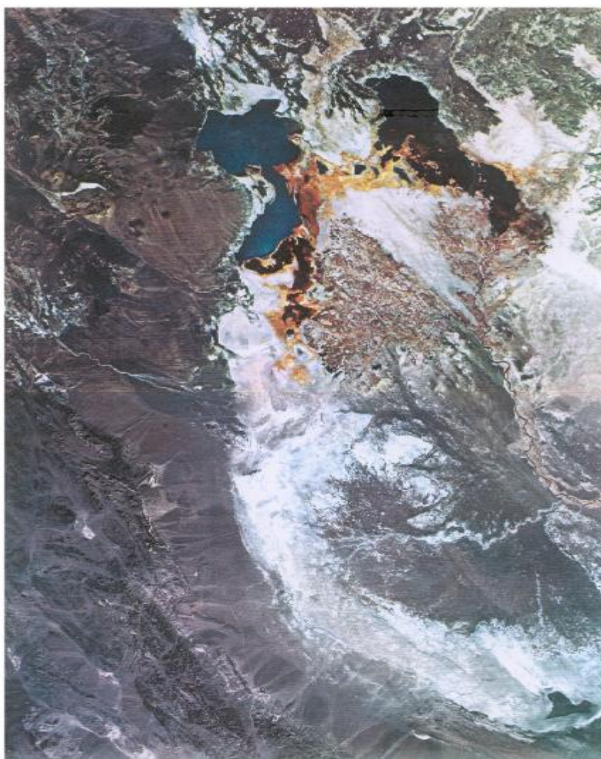
شکل ۱ سیستان، رودخانه هیرمند، دریاچه، هامون، بستر خشک رودبیبان و شهر زابل