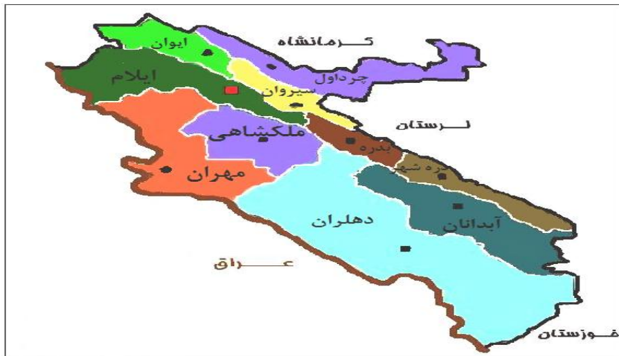
شکل 1 شکل جغرافیایی نامتعارف استان ایلام