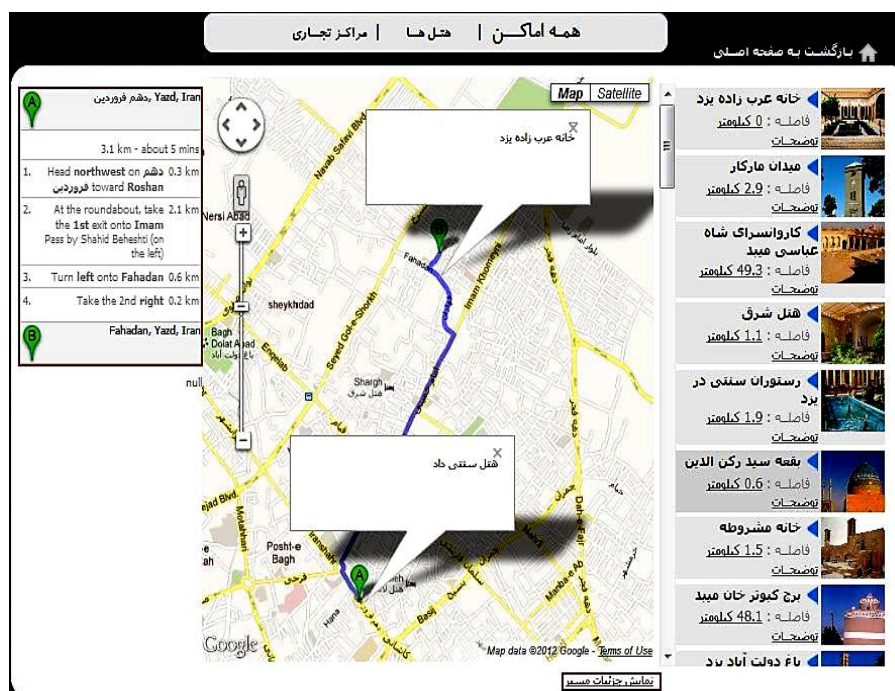
شکل ۶ نمایش امکانات مسیریابی سیستم تحت وب طراحی شده برای راهنمایی گردشگران استان یزد

با ترکیب API‌های Distance, Direction و Google Map یک برنامه کاربردی تحت وب برای گردشگرانی که قصد بازدید از مکان‌های دیدنی استان یزد را دارند، تهیه شده است. در این سیستم، به گردشگران امکاناتی نظیر ارائه کوتاه‌ترین فاصله بین مکان‌های گردشگری، فاصله آخرین مکان گردشگری تا سایر مکان‌ها و نمایش جزئیات مسیر حرکت بین مکان‌های گردشگری عرضه شده است (شکل ۶).