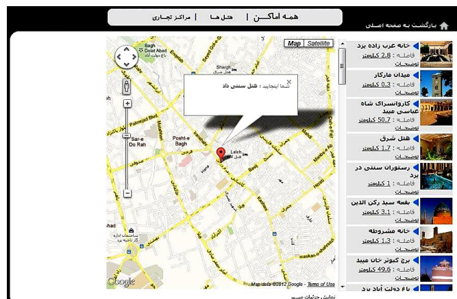
شکل ۵ نمایش فهرستی از مکان های مورد علاقه کاربر با استفاده از Google Map

پس از اتمام مراحل پالایش گروهی و پالایش محتوای محور، سیستم نتایج به دست آمده از این دو الگوریتم را با توجه به مجموع وزن پارامترهای هر مکان گردشگری مقایسه می کند و فهرستی از مکان های مورد علاقه کاربر را به صورت مرتب شده جهت نمایش روی Google Map ایجاد می کند (شکل ۵). مکان اولیه نمایش داده شده روی نقشه Google، هتل محل اقامت گردشگر است. کاربر این هتل را در مرحله تنظیمات سفر به صورت مستقیم مشخص کرده است.