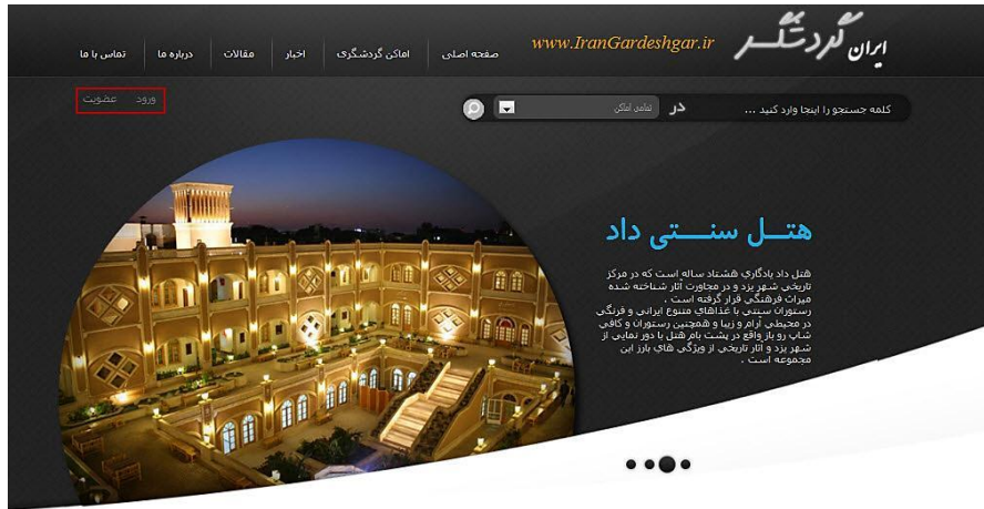
شکل ۲ صفحه اول سایت ایران گردشگر با امکان ثبت نام و عضویت کاربر

پس از اینکه کاربر وارد پروفایل کاربری می شود و عضویت خود را به منظور ارائه پیشنهاد ثبت می کند، به سمت مرحله استدلال نمونه محور هدایت می شود. در این مرحله، پانزده آیتم با توزیعی یکنواخت در پنج بخش مکان های تاریخی، تجاری، طبیعی، فرهنگی و مذهبی براساس تعداد کل آیتم های هر بخش نسبت به کل آیتم ها در پایگاه داده، به کاربر هدف عرضه می شود. با استفاده از نمونه های یادشده کاربر هدف رفتارسنجی می شود. این رفتارسنجی به این صورت است که کاربر با توجه به میزان علاقه خود به مکان مورد نظر، رتبه ای بین ۱ تا ۱۰ به آن ها می دهد. از طریق این رتبه ها، علایق و رفتارهای کاربر در مورد مکان های گردشگری شبیه به مکان های یادشده به راحتی قابل استخراج است.