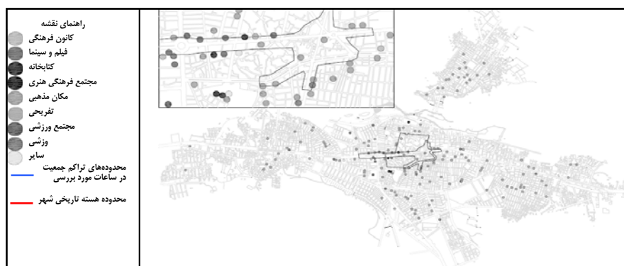
شکل ۵ نقشه پراکندگی فعالیتهای فرهنگی و محدوده تراکم جمعیت در ساعات خاصی از روز

شاخصهای اجتماعی: در بررسی عوامل اجتماعی مشخص شد که محدوده‌های اولیه توسعه شهر بوکان در ساعات خاصی از روز (۹/۵ تا ۱۱/۵ صبح و ۴/۵ تا ۶/۵ بعدازظهر) نسبت به سایر قسمتهای شهر دارای تراکم جمعیت به مراتب بیشتری است. همچنین فضاهای عمومی مهم شهر در این محدوده‌ها واقع شده‌اند که به صورت کانون برگزاری مراسم اجتماعی شهر عمل می‌کنند. یافته‌ها همچنین نشان داد که مراکز فرهنگی برتر شهر (۸۵ درصد فعالیتهای فرهنگی همانند کانونهای فرهنگی، کتابخانه، فیلم و سینما و ...) و بخش اعظم فعالیتهای پذیرایی شهر (۶۰ درصد از کل فعالیتهای پذیرایی شهر) در محدوده‌های اولیه شهر و به ویژه در هسته اصلی شهر قرار دارند که در شکلهای ۵ و ۶ نشان داده شده‌اند.