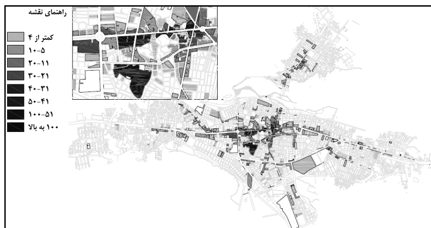
شکل ۱۰ نقشه پراکندگی فعالیت‌های شاخص بخش مرکزی در سطح شهر بوکان

فعالیت‌هایی که از آنها به‌عنوان فعالیت‌های شاخص بخش مرکزی نام برده می‌شود می‌تواند نمای کلی از تمایل به تمرکز و استقرار این فعالیت‌ها را در بخش‌های خاصی از شهر نشان بدهد. استقرار بخش اعظم این فعالیت‌ها در فضایی مشخص و به‌طور عمده در محدوده‌های اولیه توسعه شهر بوکان نشان می‌دهد که بخش‌هایی از شهر برای فعالیت‌های خاصی جذابیت ویژه‌ای دارد. تمرکز شدید این فعالیت‌ها در بخش قدیمی و هسته اصلی شهر بوکان حاکی از آن است که محدوده‌های خاصی از شهر در عین حال که فعالیت‌های متنوعی را در خود جای می‌دهد، اما بعضی از فعالیت‌ها در آن غلبه دارند. فعالیت‌هایی که اکثراً ایجاد آنها نیازمند آستانه بالایی از جمعیت است و به شرایط خاصی همانند دسترسی بالا، نیاز به همجواری با فعالیت‌های ویژه، سوددهی بالا و ... نیاز دارد که فقط در فضاهای ویژه‌ای از شهر وجود دارند. بعلاوه بعضی از این فعالیت‌ها از نوع فعالیت‌های لوکس و تخصصی هستند که در هر مکانی از شهر مستقر نمی‌شوند.