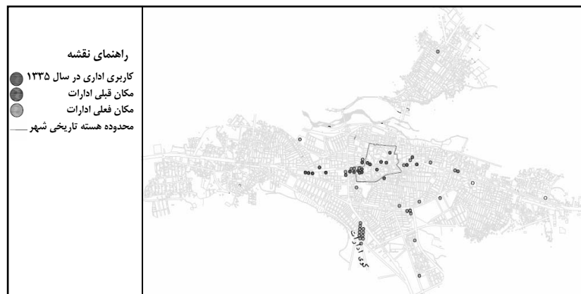
شکل ۹ روند مکان‌گزینی ادارات شهر بوکان

شاخصهای اداری: بررسی عوامل اداری نشان داد که در حال حاضر تعدادی از ادارات مهم شهر در محدوده‌های اولیه توسعه شهر قرار دارند. با این حال مقایسه فعالیت‌های اداری در دو مقطع زمانی نشان داد که در گذشته تعداد بیشتری از ادارات در این محدوده‌ها مستقر بوده‌اند و در حال حاضر بیشتر ادارت به کناره‌های شهر نقل مکان کرده‌اند. همچنین کلیه ادارات تازه تأسیس شهر در کناره‌های شهر و اکثراً به‌صورت مجتمع در ضلع شرقی شهر مستقر شده‌اند (شکل ۹).