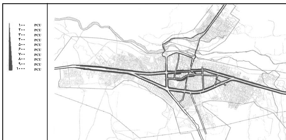
شکل ۸ نقشه حجم حمل و نقل در سطح شهر بوکان به PCU

عوامل ترافیکی تحت تأثیر سایر عوامل شکل می‌گیرند و در ارتباط مستقیم با سایر عوامل عمل می‌کنند و خود نیز سایر عوامل را تحت تأثیر قرار می‌دهند. بررسی شاخصهای منتج از عوامل ترافیکی در سطح شهر بوکان نشان می‌دهد که بیشترین ایستگاههای حمل و نقل درون‌شهری به‌صورتی متراکم در محدوده‌ای کاملاً مشخص (میدان اسکندری، خیابان ۲۲ بهمن تقاطع مولوی - انقلاب و تقاطع مولوی - بهشتی) وجود دارند و محدوده‌های نامبرده کانون جذب و تولید بسیاری از سفرهای درون‌شهری بوکان می‌باشد. بررسی خطوط حمل و نقل عمومی شهر بوکان نشان می‌دهد که این خطوط در ارتباط با سایر عوامل و به‌ویژه در ارتباط با بازار شهر تعیین مسیر شده‌اند و کل محدوده بازار را تحت پوشش قرار می‌دهند.