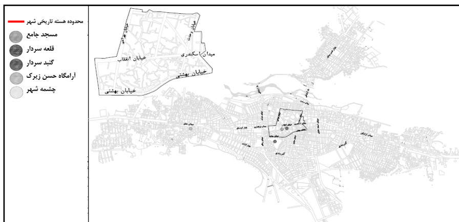
شکل ۱ نقشه هسته اصلی و عناصر شاخص و نمادین شهر بوکان

وضعیت شاخصهای مختلف در سطح شهر نشان می‌دهد که هسته اولیه شهر و محدوده‌های بلافصل آن طی توسعه شهر تا سال ۱۳۴۵، زمینه جذب بسیاری از فعالیت‌های مهم و برتر شهر را فراهم آورده است. استقرار بیشتر فعالیت‌های اقتصادی مهم شهر بوکان در هسته اولیه آن که به صورت مشخصی نسبت به سایر فعالیت‌های آن نمایان بوده و به طور عمده در قالب بازار شهر نمود یافته است، نشان‌دهنده نقش و اهمیت عامل تاریخی در جذب و تمرکز آنها در محدوده‌های خاصی از شهر می‌باشد. در واقع محدوده‌های اولیه توسعه شهر بوکان علاوه بر داشتن ویژگیهای تاریخی و هویتی، معرف تمرکز بسیاری از فعالیت‌های مهم شهر نیز می‌باشد.