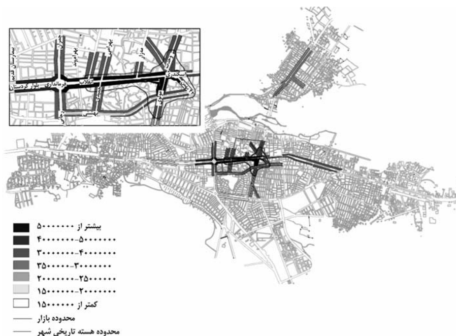
شکل ۳ نقشه محدوده بازار شهر و ارزش زمین و سرقفلی واحدهای تجاری

همچنین یافته‌ها نشان داد که ۱۰۰ درصد مؤسسات مالی و اعتباری، ۶۶ درصد بانکها و ۷۰ درصد فعالیتهای بیمه و تأمین اجتماعی به‌عنوان فعالیتهای برتر در مقیاس یک شهر میانی، در هسته و محدوده‌های اولیه توسعه شهر قرار دارند (شکل ۴).