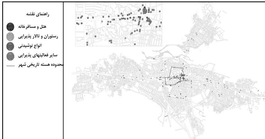
شکل ۶ نقشه پراکنندگی فعالیتهای پذیرایی در سطح شهر بوکان

عوامل جمعیتی - اجتماعی در تبیین فضای شهر از آن جهت مهم هستند که نگرش و طرز تلقی شهروندان را نسبت به فضاهای شهری نمایان می‌سازند. فعالیتهای فرهنگی برتر شهر بوکان (همانند کانونهای فرهنگی، مجتمعهای فرهنگی، فیلم و سینما و ...) به‌طور عمده در محدوده‌های اولیه توسعه شهر مستقر شده‌اند. تمرکز فعالیتهای فرهنگی مهم شهر در قسمتهای درونی آن حاکی از اهمیت بالای بخشهای خاصی از شهر می‌باشد، چرا که چنین فعالیتهایی علی‌رغم این‌که از نظر اقتصادی سود مستقیم ندارند، اما با وجود قیمت بالای زمین توانسته‌اند جایگاه خود را در قسمتهای درونی شهر حفظ کنند.