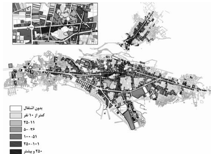
شکل ۲ تراکم اشتغال در سطح شهر بوکان

شاخصهای اقتصادی: بررسی عوامل اقتصادی نشان داد که بالاترین تراکمهای اشتغال (تراکمهای بالای ۱۰۰ نفر و به ویژه ۲۵۰ نفر و بیشتر در هکتار) در هسته اولیه توسعه شهر و محدوده‌های بلافصل آن وجود دارد که در شکل ۲ نشان داده شده است.