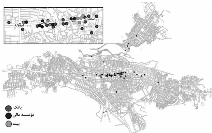
شکل ۴ نقشه پراکندگی بانکها، مؤسسات مالی و بیمه

تمرکز فعالیت‌های مهم و برتر شهر بوکان در محدوده‌های مشخصی از آن به صورت بارز و مشهود نمایان است. محدوده بازار به عنوان رکن اصلی فعالیت‌های اقتصادی مهم شهر از نظر سایر ویژگی‌ها همانند قیمت زمین، تمرکز بانکها، مؤسسات مالی و بیمه، و تراکم اشتغال، تفاوت بارزی را با سایر قسمتهای شهر نشان می‌دهد.