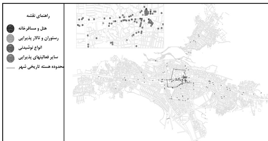
شکل ۶ نقشه پراکندگی فعالیتهای پذیرایی در سطح شهر بوکان

عوامل جمعیتی - اجتماعی در تبیین فضای شهر از آن جهت مهم هستند که نگرش و طرز تلقی شهروندان را نسبت به فضاهای شهری نمایان می‌سازند. فعالیتهای فرهنگی برتر شهر بوکان (همانند کانونهای فرهنگی، مجتمعهای فرهنگی، فیلم و سینما و ...) به‌طور عمده در محدوده‌های اولیه توسعه شهر مستقر شده‌اند. تمرکز فعالیتهای فرهنگی مهم شهر در قسمتهای درونی آن حاکی از اهمیت بالای بخشهای خاصی از شهر می‌باشد، چرا که چنین فعالیتهایی علی‌رغم این‌که از نظر اقتصادی سود مستقیم ندارند، اما با وجود قیمت بالای زمین توانسته‌اند جایگاه خود را در قسمتهای درونی شهر حفظ کنند.