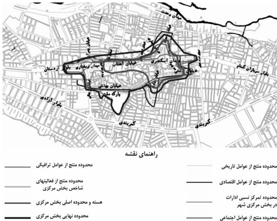
شکل ۱۱ نقشه محدوده بخش مرکزی شهر بوکان بر اساس عوامل شش‌گانه

محدوده بخش مرکزی شهر بوکان: بر اساس مجموعه شاخصها هسته اصلی بخش مرکزی شهر بوکان شامل محدوده‌ای است که منطبق بر محدوده بازار شهر می‌باشد. محدوده‌ای که شامل خیابان انقلاب از میدان اسکندری تا خیابان کمالی، خیابان مولوی حد فاصل خیابان بهشتی تا خیابان انقلاب، بدنه میدان اسکندری، خیابان ۲۲ بهمن، بخشهایی از خیابان نجاری و وحدت، کوچه ضلع جنوبی خیابان مولوی که از نظر بسیاری از شاخصها تفاوت اساسی با محیط اطراف خود دارد، می‌شود. وضعیت شاخصهای مختلف نشان می‌دهد که با دور شدن تدریجی از محدوده یاد شده به تدریج از تمرکز و تراکم فعالیتها کاسته می‌شود. بنابراین بر اساس مجموعه شاخصها