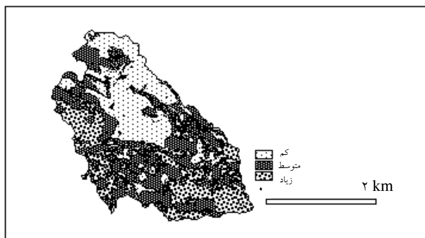
شکل ۳ نقشه درجه‌بندی بحران آب در دشت نیشابور