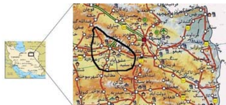
شکل ۱ موقعیت دشت مورد مطالعه

مورد توجه قرار گرفته است. در همین زمینه Yang و همکاران در رودخانه زرد چین مطالعاتی انجام دادند، به این نتیجه رسیدند که شرایط آبیاری در چین تحت تأثیر مستقیم بارش و میزان تبخیر قرار داشته و در دهه‌هایی که بارش بیشتر و میزان تبخیر کمتر بوده امکان آبیاری بهتری فراهم بوده است [۵]. فرت ۱ و وارد ۲ نیز به بررسی اثر برنامه‌ریزی کاربری اراضی کشاورزی بر کیفیت آب زیرزمینی پرداختند. آنها در این بررسی به نقش سموم حاصل از فعالیتهای کشاورزی در آلوده ساختن آبهای زیرزمینی پرداختند و ضرورت سیاستگذاریهای مناسب را برای جلوگیری از این امر توصیه کردند [۶]. در دشت نیشابور نیز مسأله بحران آب، در نتیجه به هم خوردن تعادل هیدرولوژیکی و افزایش تقاضا از منابع آبی از سال ۱۳۶۵ به بعد نمود پیدا کرده است و چنانچه بهره‌برداری به صورت بی‌رویه از منابع آب و الگوی بیلان منفی از منابع موجود، متوقف نشود به تدریج حجم آب شیرین و قابل‌استفاده کاهش خواهد یافت و مسأله بحران آب، منجر به تهی شدن کامل مخازن آب زیرزمینی دشت شده، تمام سرمایه‌گذاریهای انجام شده از بین خواهد رفت. دشت نیشابور، جزئی از حوضه آبریز کال‌شور نیشابور است که در شمال شرق کویر مرکزی واقع شده است. شکل ۱ نشان‌دهنده موقعیت منطقه مورد مطالعه است.