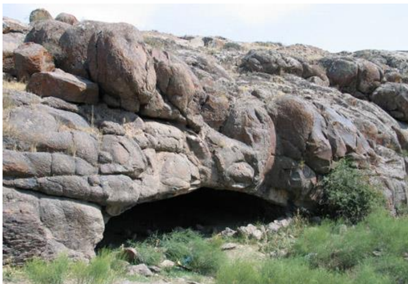
شکل ۴ نمونه غارهای شناسایی شده در اطراف محوطه شهریری

چند غار طبیعی با وسعت قابل توجه در اطراف محوطه فضای مناسبی برای نگهداری دام برای ساکنان ایجاد می‌کرده است (پورفرج، ۱۳۸۶:۴۲۷) (شکل ۴).