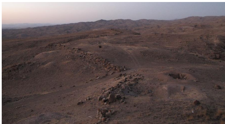
شکل ۵ دیوار دفاعی قلعه شهریری

شده به ۵۳۴ متر می‌رسد و پهنای دیوار حداقل ۱۶۰ سانتی‌متر و حداکثر ۲/۵ متر است. در طول این دیوار آثار ۵ برج و ۴ دروازه قابل مشاهده است که دروازه ورودی اصلی در انتهای جنوبی شهر سفلی و ورودی دیگری نیز در شرق شهر سفلی وجود داشت که با دیوارهای عظیم و دو برج محافظت می‌شد. دیوار دفاعی با استفاده از سنگ‌های نتراشیده بزرگ ساخته و میان آن‌ها را با سنگ‌های به نسبت کوچک‌تر پر می‌کرده‌اند (تصویر ۵). قطر دیوار حصار بین ۱۴۰ تا ۱۵۰ سانتی‌متر بوده که نزدیک دروازه به ۲۰۰ سانتی‌متر می‌رسد. عرض دروازه نیز ۵/۵ متر است. در جهت شمال غرب قلعه پرتگاهی وجود دارد که عظمت خاصی را به این محوطه بخشیده و حصار طبیعی در این قسمت از قلعه را به وجود آورده است. قسمت‌های داخل قلعه متشکل از فضاهای متعدد اتاق‌ها، راهروها و فضاهای حیاط مانند بوده است. در ضلع شمال شرقی که به صورت یک تراس بلند است با ایجاد ترانشه A، پنج اتاق تودرتو شناسایی گردید. دیوارهای این اتاق از سنگ‌های بدون تراش (سیکلوپین) و بدون استفاده از ملات ساخته شده است (هژبری نویری، ۱۳۸۳).