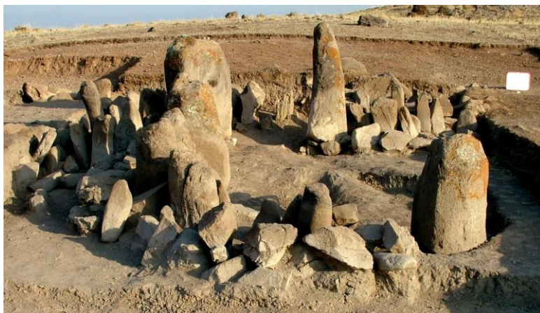
شکل ۲ معبد روباز اولیه واقع در داخل قلعه متعلق به فاز شکل‌گیری محوطه

می‌شود که در داخل آن سکویی قرار گرفته است. به نظر می‌رسد این فضا الحاقی به معبد بوده و به عنوان اتاق هدایا و سکوی هدایا کاربرد داشته است (هژبری نویری، ۱۳۸۴).