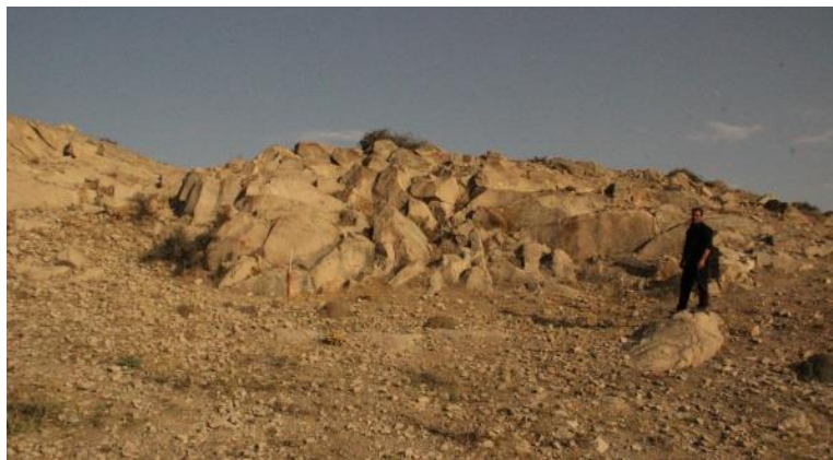
شکل ۳ معدن سنگ خام سنگ‌افراشته‌های انسان ریخت محوطه شهری

همچنین دسترسی و وجود معدن سنگ خام برای ساخت سنگ‌افراشته‌های انسان ریخت که جز لاینفک مراسم آیینی این اقوام بوده برای ساکنان واجد اهمیت بوده است. با توجه به شناسایی معدن سنگ خام مناسب در فاصله سه کیلومتری از محوطه این مهم را میسر ساخته که این امر می‌تواند یکی از پتانسیل‌های مکان‌گزینی محوطه مورد نظر قرار گیرد (شکل ۳).