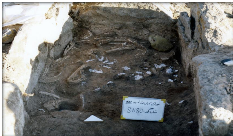
شکل ۸ قبر شناسایی شده در گورستان محوطه شهری

۷- تحلیل متغیرهای تأثیرگذار بر توسعه محوطه شهری در عصر آهن میانی برخورداری از پتانسیل‌های محیطی و قرارگرفتن در مسیر ارتباطی، در پهن‌دشت شهری باعث انباشت ثروت، افزایش جمعیت و در نهایت ایجاد طبقات اجتماعی مختلف شده است. به نظر می‌رسد بخشی از جامعه به واسطه ساخت قلعه، به زندگی در آن روی آورده‌اند، اما قسمت اعظم جامعه به همان شیوه معیشت نیمه کوچ‌نشینی ادامه داده‌اند. عدم شناسایی محوطه استقرار متناسب با جمعیت گورستان با وجود انجام بررسی‌های باستان‌شناختی در محوطه می‌تواند دلیلی بر این مدعا باشد.