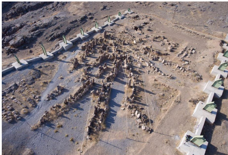
شکل ۶ نمای کلی فضای محوطه معبد

و عرض ۱ تا ۳ متر را شامل است که کف آن‌ها در بعضی موارد توسط سنگ‌های تخت همراه با خاک قرمز کوبیده شده و در بعضی موارد دیگر نیز توسط اندودی قرمز رنگ و کوبیده شده به ضخامت ۵ تا ۱۰ سانتی‌متر پوشیده شده است. هر دو طرف این راهروها تعداد ۵۳۷ سنگ افراشت ۱ منقور به نقوش استلیزه انسانی با ارتفاعی متغیر بین ۳۵ تا ۲/۳۰ سانتی‌متر و اشکال متنوع به شکل‌های مکعب مستطیل و یا مخروطی که به دیواره‌هایی با فونداسیونی متشکل از لاشه سنگ‌های همراه با ملاط گل تکیه داده و در برخی موارد جلو پای آن‌ها سنگ تختی به عنوان سکوی هدایا قرار گرفته، تزیین شده‌اند (هژبری نوبری، ۱۷۰:۱۳۸۳) (شکل‌های ۶ و ۷). در پای استل‌ها نذوراتی اعم از سفال و اشیای زینتی قرار داده شده که همین امر فرضیه آیینی بودن این مکان را قوت می‌بخشد (همان).