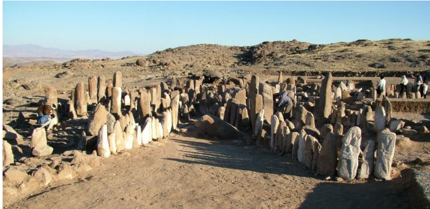
شکل ۷ نمایی کلی از محوطه معبد