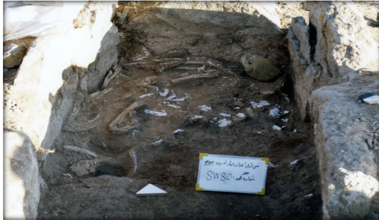
شکل ۸ قبر شناسایی شده در گورستان محوطه شهری

۷- تحلیل متغیرهای تأثیرگذار بر توسعه محوطه شهری در عصر آهن میانی برخورداری از پتانسیل‌های محیطی و قرارگرفتن در مسیر ارتباطی، در پهندشت شهری باعث انباشت ثروت، افزایش جمعیت و در نهایت ایجاد طبقات اجتماعی مختلف شده است. به نظر می‌رسد بخشی از جامعه به واسطه ساخت قلعه، به زندگی در آن روی آورده‌اند، اما قسمت اعظم جامعه به همان شیوه معیشت نیمه کوچ‌نشینی ادامه داده‌اند. عدم شناسایی محوطه استقرار متناسب با جمعیت گورستان با وجود انجام بررسی‌های باستان‌شناختی در محوطه می‌تواند دلیلی بر این مدعا باشد.