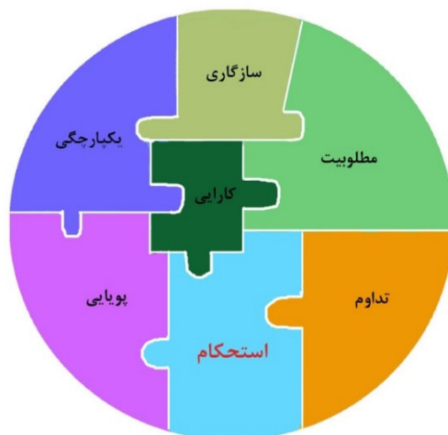
شکل ۱. موزائیک هویت بخش مؤلفه‌های مسکن پایدار روستایی

بدین ترتیب به عنوان نتیجه می‌توان اذعان کرد که اگرچه تاکنون با مقیاس‌های متفاوت به ارزیابی مسکن روستایی پرداخته شده، ولی بهره‌گیری از مؤلفه‌های ساختی و کارکردی بیش از سایر مؤلفه‌ها مورد تأکید قرار گرفته شده است. براساس شکل ۱ تأکید بر ۷ مؤلفه کلیدی سازگاری، مطلوبیت، یکپارچگی، کارایی، تداوم، استحکام و پویایی موزائیک تشکیل‌دهنده نظام پایداری مسکن روستایی را تشکیل می‌دهند.